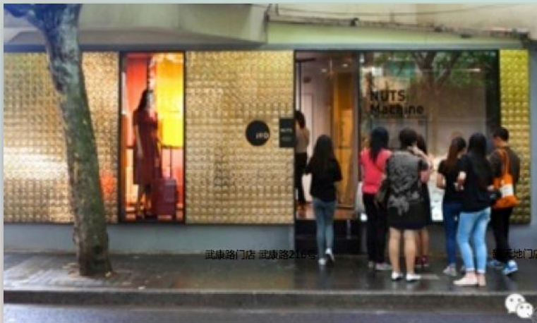
武康路门店 武康路216号